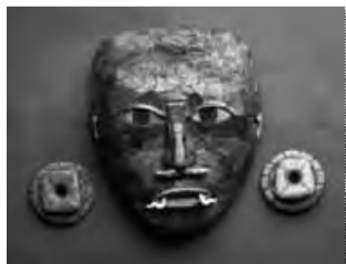
アステカ文明 ヒスイの仮面

一番辛く苦しかった思い出は、なんといってもメキシコシティで「モクテスマの復讐」に遭ってしまい、「おかあちゃん、何でもしゃべります。もう悪さはしないから堪忍して下さい!」って懇願しちゃうような瀕死の状態を3日間寝込んでしまったことである。復讐とは、スペインのコルテスに滅ぼされたアステカ王国最後の王、モクテスマ2世の怨念が食べ物に乗り移って、異邦人に襲いかかることなのだ。彼に襲われると健康のバロメーターである山吹色の固形物の排せつが困難になる。そしてまるで鉄の爪を持ったプロレスラー、フリッツ・F・エリックにストマッククローを仕掛けられ、のたうち回ったアントニオ、猪木のようにになってしまう。五臓六腑がねじれるような痛みが襲い、10分おきにお尻から水分だけの排せつが始まり、それが延々と続くのである。加えて彼の地は2千メートルを超える高地にあり、空気も薄い、文字通り息も絶え絶え瀕死の状態、まさにまな板の上の鯉太郎になってしまった。食べ物や生水には気を付けていたが、おそらく彼の怨念は、果物やサラダを切ったナイフに潜んでいたのではないだろうか。先月も受けたばかりだが、太陽カメラ検査(CF)の下剤をいたたく度に、アステカ王国最後の王のことを思い出す。